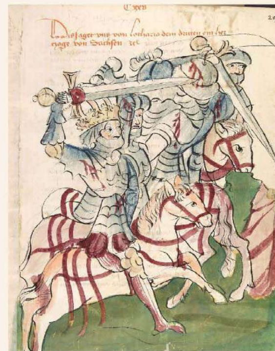
Lothar III. v bitvě u Chlumce,

Na paměť slavného vítězství nechal Soběslav vybudovat na Řípu rotundu Sv. Jiří.